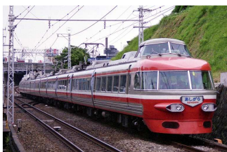
NSE (3100 形)