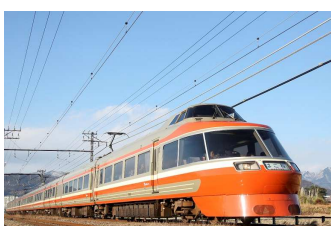
LSE (7000 形)