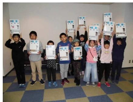
河内長野市内の子ども教室にて、実施した「ペーパークラフト自動販売機キット」の制作風景（2018年12月）